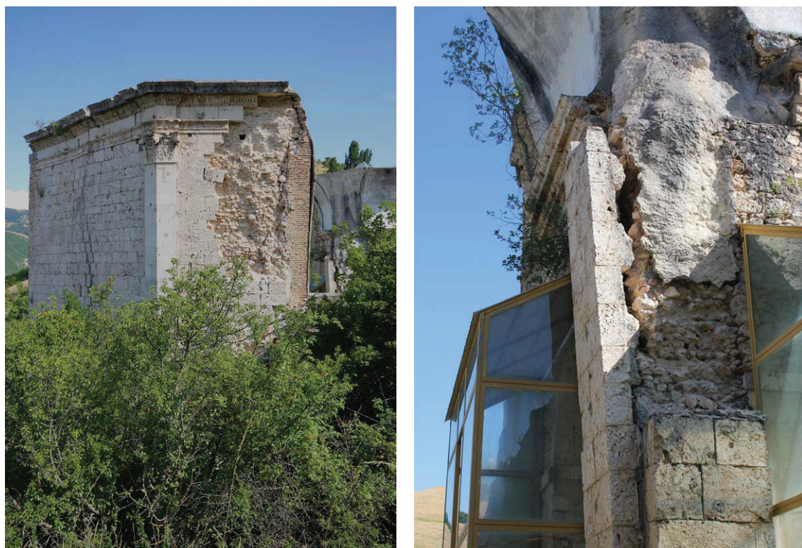
Figg. 5a-5b. Cascia, S. Maria della Neve (particolari). Sono evidenti le precarie condizioni in cui versa l'apparecchio murario della chiesa (foto D'Avino 2024).

si spingono oltre le sole sistemazioni ambientali dettate dall'istanza storica e più disposte ad accogliere anche proposte indirizzate a soddisfare le valenze proprie dell'istanza estetica; un tema, quello delle integrazioni di monumenti allo stato di rudere, che risente del più generale andamento del dibattito disciplinare. Resta tuttavia inteso che ogni intervento che si renda necessario sull'opera ovvero sulla sua materia, nel rispetto della sua autenticità, non potrà che configurarsi come un atto d'interpretazione, prettamente attuale e moderno, nelle sue ragioni e nella sua concreta espressione; atto contestualmente critico e creativo, compiuto nello 'stato attuale' dell'opera ed insieme attento ai diversi livelli di stratificazione determinatisi nel corso della Storia.