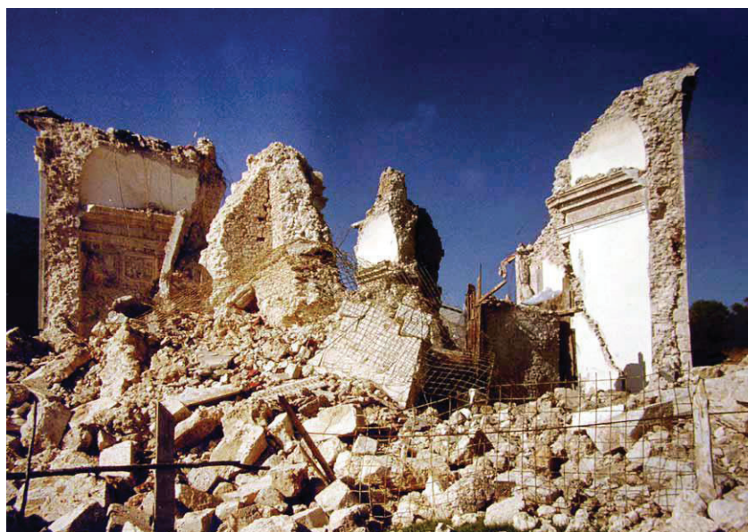
Fig. 3. Cascia, i resti della chiesa di S. Maria della Neve dopo il terremoto del 19 settembre 1979.

quando la chiesa aveva oltretutto subito un'ulteriore scossa sismica (1928).