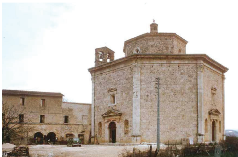
Fig. 1. Cascia, la chiesa di S. Maria della Neve (prima metà del '900).

Secondo quanto si apprende dalle fonti, la costruzione del santuario prese avvio il 13 ottobre 1565 con il riconoscimento ufficiale da parte della Chiesa di un miracolo che in quel luogo sa-