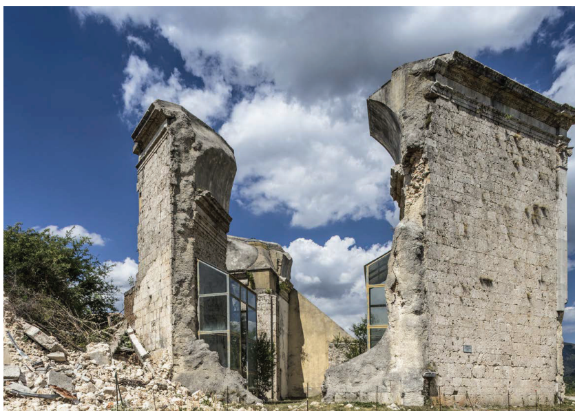
Fig. 4. Cascia, i resti della chiesa di S. Maria della Neve.

dall'agosto di quell'anno hanno infatti aggravato le già precarie condizioni di stabilità dei ruderi, manifestatesi in un'apprezzabile variazione della geometria degli apparecchi murari e in fenomeni di ribaltamento delle paraste che già sostenevano la volta a botte unghiata di sud-est; sono altresì state rilevate evidenti soluzioni di continuità tra gli elementi resistenti ed un sensibile disassamento nella porzione muraria di nord-est con la conseguente attivazione di una azione di ribaltamento dei piani verticali. È altresì emerso come gli interventi di consolidamento dei ruderi condotti dopo il 1979, realizzati mediante la posa di rete elettrosaldata atta (nelle intenzioni di progetto) a ridurre il rischio di discretizzazione della massa muraria interna, si siano rivelati totalmente privi di efficacia, esprimendo un'insoddisfacente prestazione in termini di contenimento delle sollecitazioni cui la struttura era sottoposta (fig. 5).