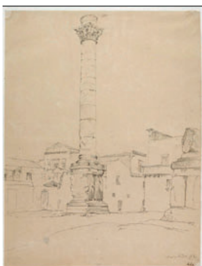
Frans Vervloet (Mechelen, 1795 - Venezia, 1872), Le colonne di Brindisi , disegno, Istituto centrale per la grafica.

La mostra Regina Viarum. La via Appia nella grafica tra Cinquecento e Novecento , è stata dedicata alla celebre strada consolare in occasione della sua candidatura alla Lista del Patrimonio Mondiale dell'UNESCO proposta dal Ministero della Cultura nel gennaio del 2023 (l'inserimento nella WHL è stato deliberato dalla Commissione Unesco riunitasi a New Dehli il 27.07.2024). Sono state esposte 72 opere, selezionate grazie a una ricerca capillare nelle collezioni dell'Istituto Centrale per la Grafica, che raccontano attraverso disegni, incisioni, matrici, libri e fotografie la fortuna iconografica dell'Appia con opere di Giovan Battista