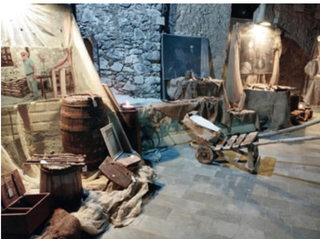
Mostra I Bottai di Rocca Santo Stefano (Comune di Rocca Santo Stefano).