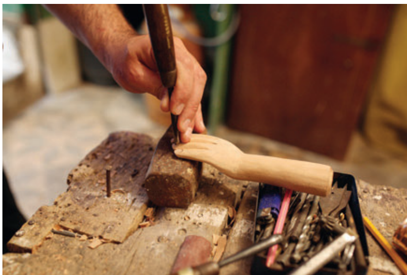
Realizzazione di una mano di pupo di Palermo.

cupazione giovanile. Il Protocollo di sostenibilità previsto e le attività per l'accessibilità e inclusione supportano la parità di genere (OB5), riducono le disuguaglianze offrendo pari opportunità per tutti (OB10), promuovono un consumo e forme di produzione tradizionali sostenibili anche fondate sul riciclo (OB12) contrastando il cambiamento climatico (OB13).