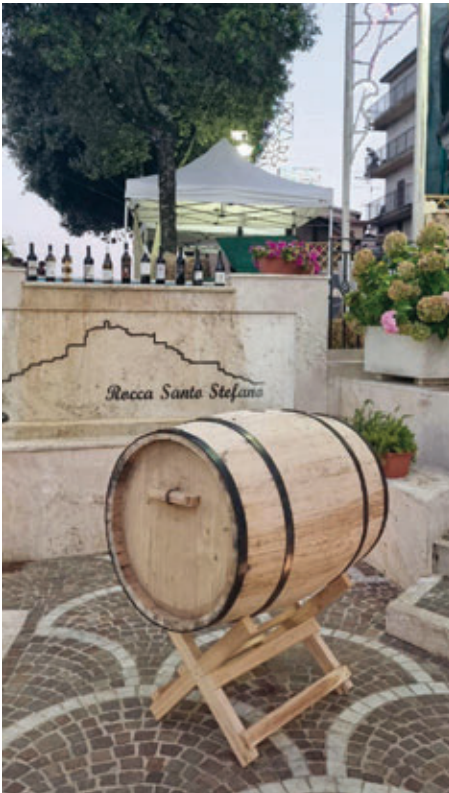
La botte della tradizione nella piazza del paese (Comune di Rocca Santo Stefano).

registrato anche la presenza di visitatori e turisti, che hanno apprezzato l'intento e la finalità del progetto tutt'ora in corso. Il pubblico esterno aveva infatti avuto modo di conoscere il progetto grazie ad una capillare attività di divulgazione svolta a partire dal 2022 e che ha visto la realizzazione, tra le altre cose di una brochure dedicata e di un docufilm, consultabile al link: https://www.youtube.com/watch?v=JlStNDV-0dgU in cui il sindaco e gli amministratori presentano il progetto e