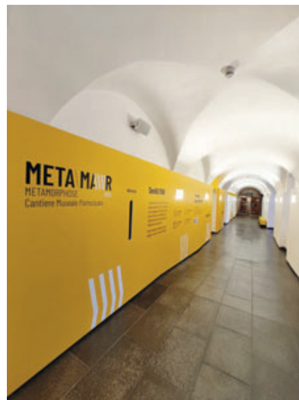
Corridoio di ingresso, personalizzazione (lato entrata)

UN MUSEO IN DIVENIRE: dal 25 novembre 2023, il museo ha aperto le sue porte al pubblico con una veste completamente nuova. I visitatori sono accolti da pannelli informativi di un vivace giallo "cantiere", una segnaletica rinnovata e nuovi supporti di comunicazione che trasformano gli spazi espositivi in un laboratorio vivo di idee e riflessioni.