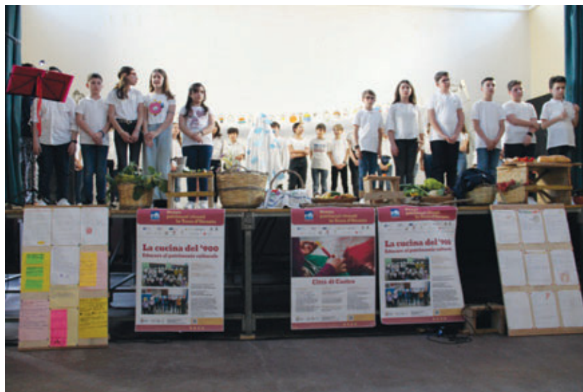
Educazione al patrimonio culturale. Evento conclusivo "La cucina del '900", ICS di Minervino di Lecce e Castro.