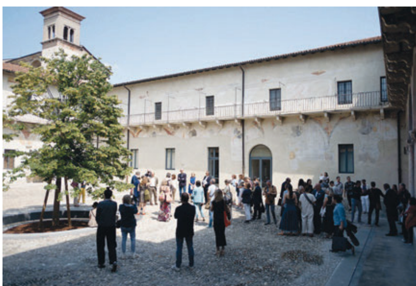
Chiostro di Santa Maria in Solario - Corridoio UNESCO

Santa Giulia. Gli spazi esterni sono considerati parte integrante degli spazi museali e sono stati soggetti negli ultimi anni a operazioni di sistemazione, ma anche di contaminazione con l'arte e la società contemporanea.