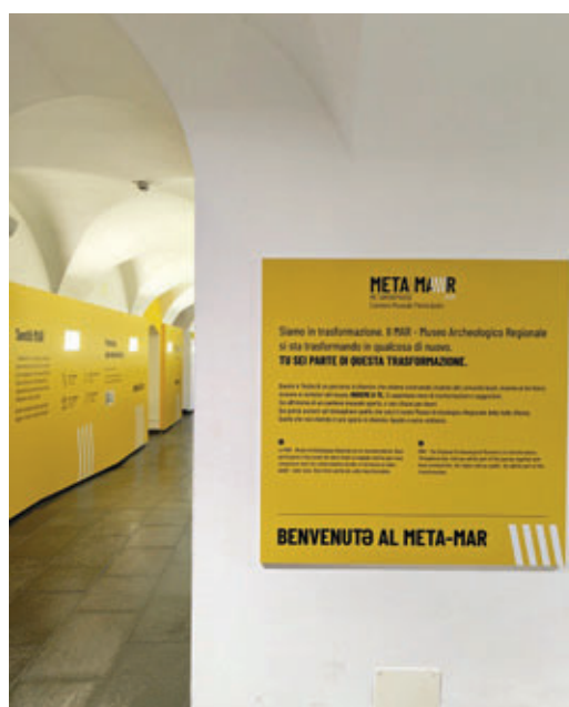
Comunicazione ingresso museo.