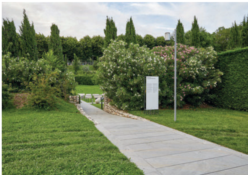
Accesso al Parco delle sculture del Viridarium