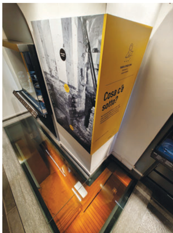
Comunicazione sale sottosuolo.