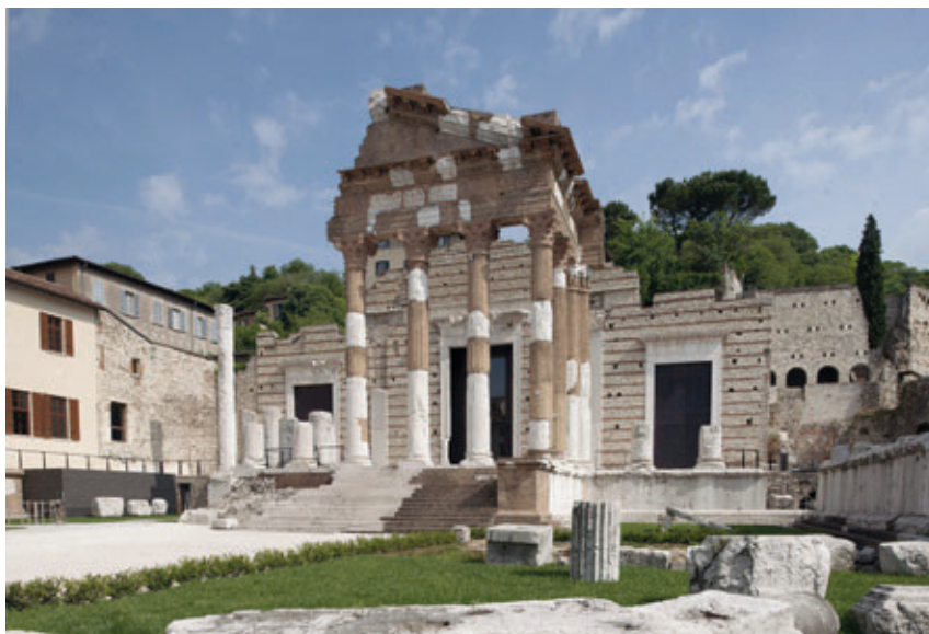
Brixia. Parco archeologico di Brescia romana.