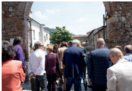
Varco di via Piamarta sul Chiostro di San Salvatore - Corridoio UNESCO