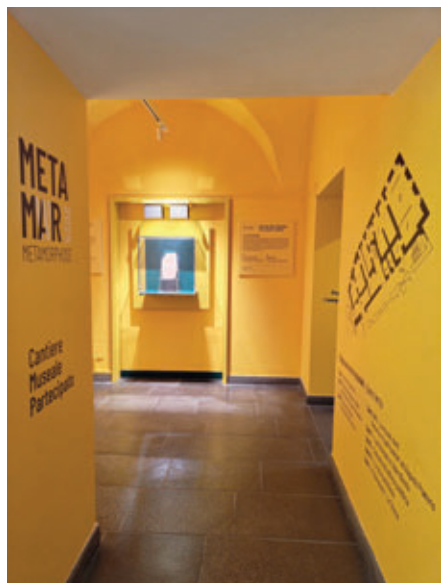
Personalizzazione sala ingresso e guida alla visita.