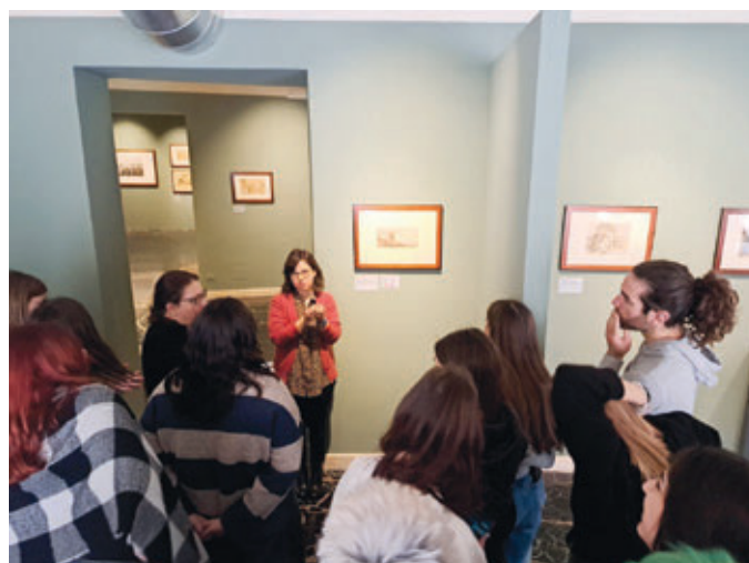
Attività didattiche in mostra.