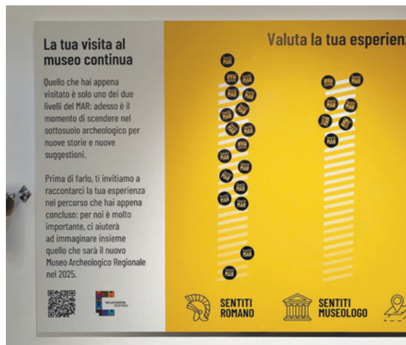
Pannello valutazione sala di uscita.

Questo progetto non solo sta trasformando un museo, ma sta anche ridefinendo il ruolo delle istituzioni culturali nella società contemporanea. Il META/MAR è più di un museo: è un laboratorio di idee, un ponte tra passato e futuro, un patrimonio vivente che cresce e si evolve insieme alla sua comunità.