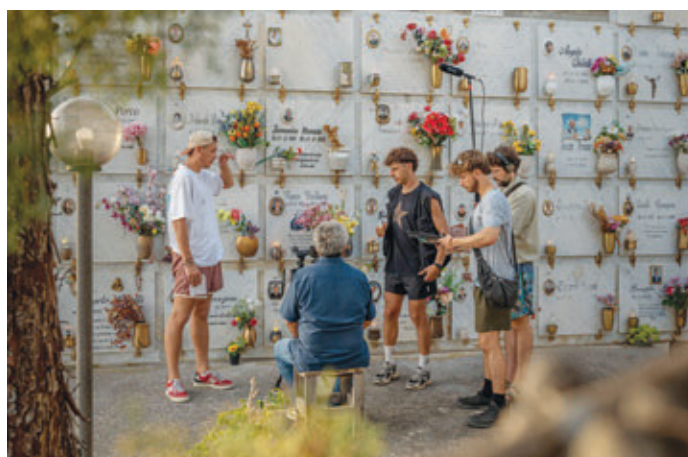
Shooting Cimitero Amantea.