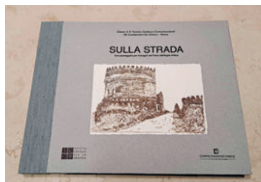
Libro in formato leporello con le incisioni degli studenti dell'Istituto Confalonieri-De Chirico di Roma.