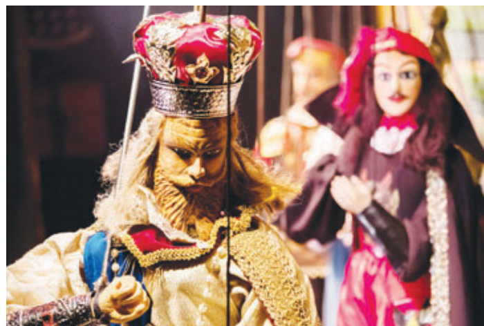
Pupi di stile palermitano in scena.