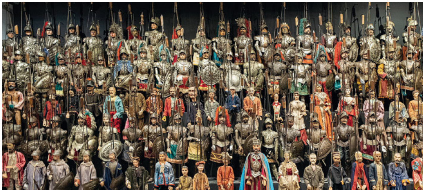
Museo internazionale delle marionette Antonio Pasqualino, sala dell'Opera dei pupi (Foto di Giacomo Bordonaro).

sco per la salvaguardia del patrimonio culturale immateriale del 2003 (CICH)