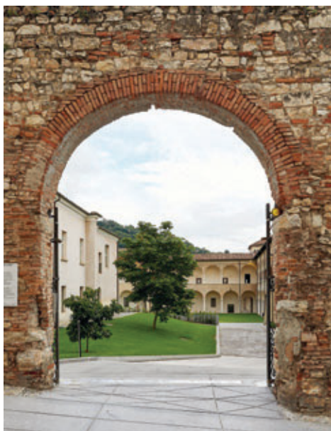
Portale del Chiostro di San Salvatore con il loggiate ©Archivio Fotografico Civici Musei di Brescia – Photo Tomás Quiroga.