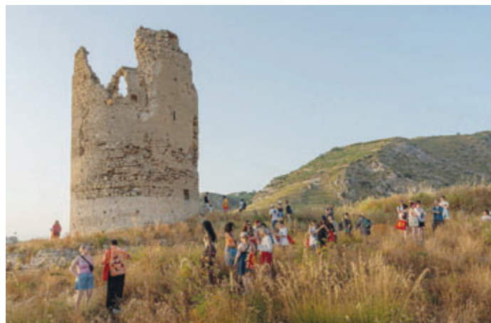
Old Town Tour.

munità locale s'incontrano e si conoscono, per lavorare e creare insieme.