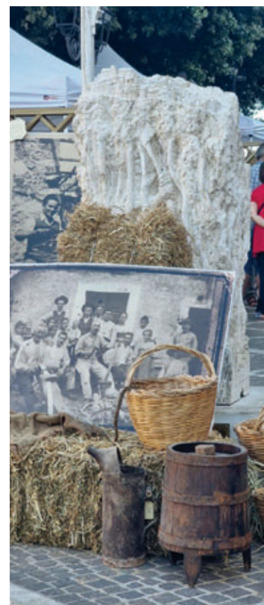
La mostra i Bottai di Rocca Santo Stefano allestita in piazza. La scultura dedicata al boscaiolo fa da sfondo.