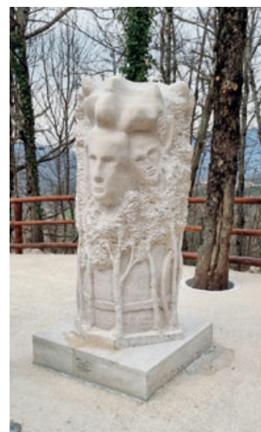
Scultura in travertino romano Il Bottai, arte natura e tradizione, Porta del Bottai Rocca S. Stefano (Comune di Rocca S. Stefano).