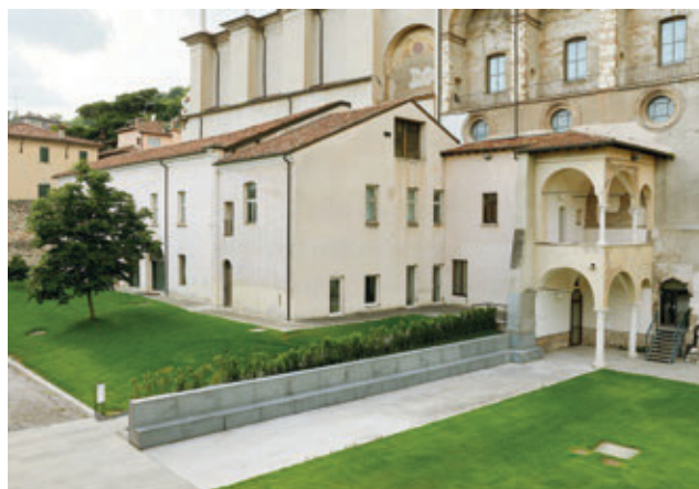
Chiostro di San Salvatore ©Archivio Fotografico Civici Musei di Brescia – Photo Tomás Quiroga.

donale, aperto liberamente e gratuitamente in orario museale, segue una sequenza che consente di toccare, da ovest verso est (area Capitolium), l'area dei templi, il teatro, un vicolo medievale, (area Santa Giulia) il Chiostro meridionale di San Salvatore, il Chiostro di Santa Maria in Solario, sino al Parco del Viridarium delle domus romane con le installazioni di arte contemporanea – il Terzo Paradiso di Michelangelo Pistoletto (2015), Untitled di Ariel Schlesinger (2019), Formiamo umanità (Vite operose) di Valerio Rocco Orlando (2023), Mondo d'acciaio di Emilio Isgrò (2023) – e un ampio parco. Con 102 alberi e 18 specie diverse, gli spazi esterni pari a 13.870 m 2 tra Parco archeologico e Museo di