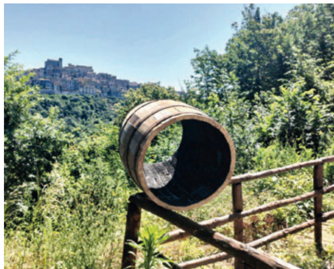
La botte in costruzione alla Porta del Bottaio. Sullo sfondo Rocca Santo Stefano. (Comune di Rocca Santo Stefano).

Il progetto, condotto in collaborazione con le realtà associative locali, il centro sociale anziani APS e il Consiglio dei giovani è fortemente partecipativo. Oltre alla necessaria ricerca d'archivio (comunale e parrocchiale), utile ad individuare i nuclei familiari che praticavano il mestiere in questione, sono state raccolte testimonianze orali, sotto forma