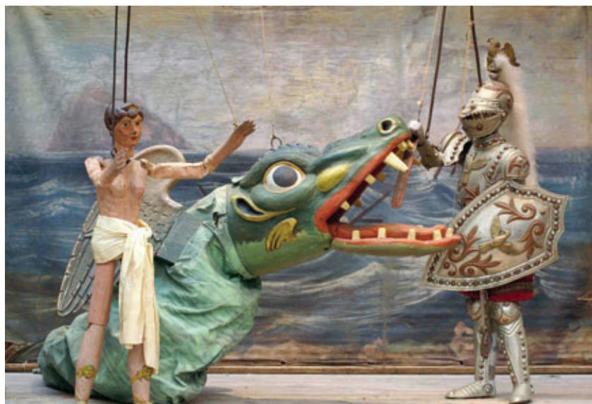
Angelica, l'orca marina e Astolfo, pupi di Palermo, Museo internazionale delle marionette Antonio Pasqualino (Foto di Giacomo Bordonaro).

zie al coinvolgimento delle nuove generazioni e all'interazione con altri Elementi Unesco.