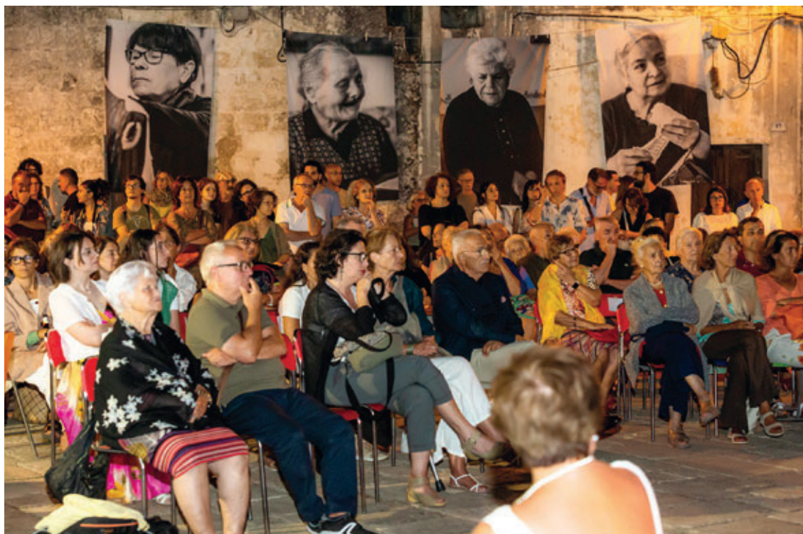
Panni de Vinti. Evento di restituzione nel rione Puzzu di Tricase.