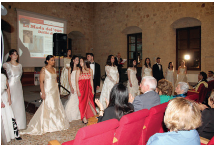
Educazione al Patrimonio Culturale_Sfilata di moda del '900. IISS Polo Professionale Don Tonino Bello di Tricase – indirizzo Abbigliamento e moda.

3. Viaggi esplorativi "Dal racconto la bellezza": è stata realizzata una residenza teatrale guidata dal regista e attore Ippolito Chiarello in cui sono state trasformate le storie di vita raccolte dall'Archivio Liquilab in copioni teatrali e creato lo spettacolo "Donne di terra e di mare" e una residenza di canto tradizionale a coro con brani legati alla protesta e al lavoro femminile curata dalla cantante Anna Cinzia Villani che ha portato alla realizzazione dello spettacolo "Donne, tessuti e vissuti".