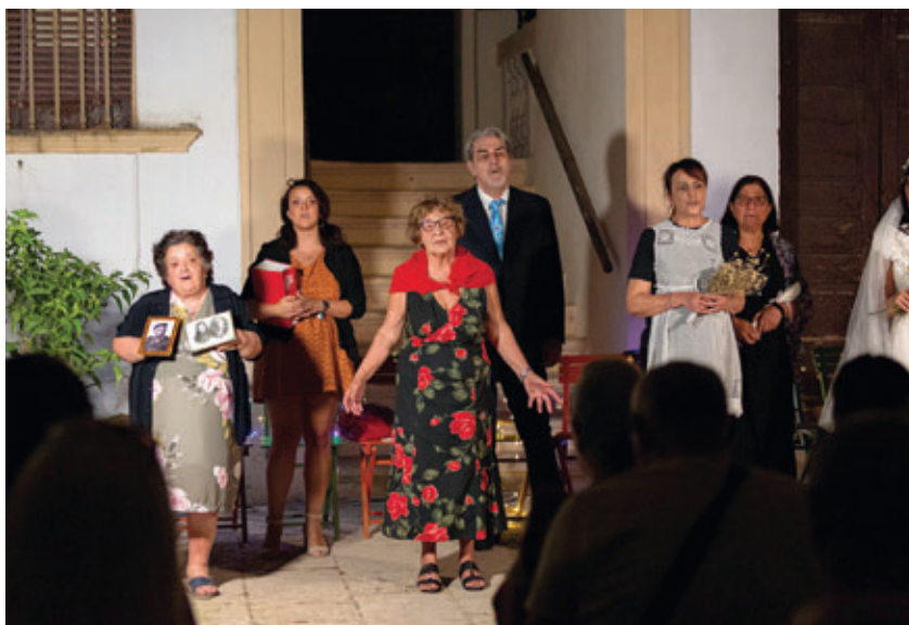
Performing Art "Donne di terra e di mare". Regia Ippolito Chiarello. Tricase.

Entrambi i percorsi miravano altresì all'educazione e sensibilizzazione delle nuove generazioni verso il recupero dell'identità di luoghi femminili della memoria per un migliore e maggiore radicamento al territorio.