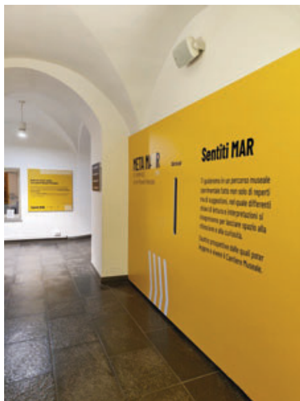
Corridoio di ingresso, personalizzazione.