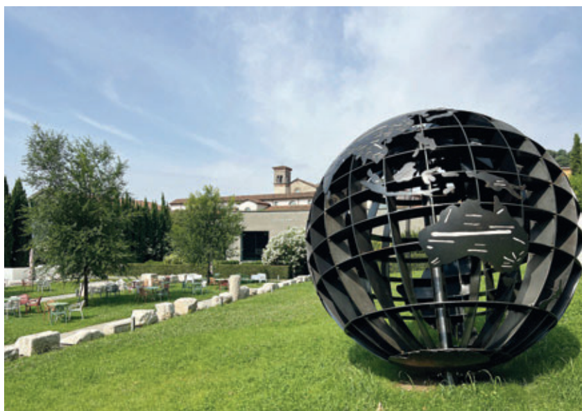
Parco delle sculture del Viridarium

sperienza di valorizzazione del patrimonio culturale e il ruolo del lavoro visto come strumento di definizione individuale e di integrazione sociale. Tra le riflessioni emerse, l'artista ha selezionato una frase emblematica, trascrivendola in una scultura di luce al neon, in edizione unica.