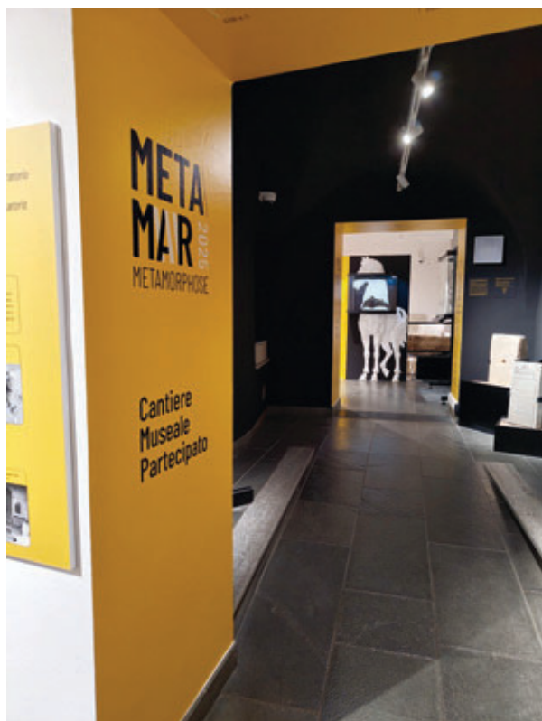
Identità visita museo "METAMAR".