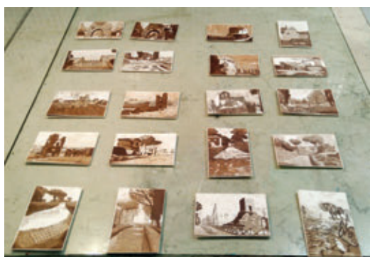
Cartoline realizzate dagli studenti dell'Istituto Confalonieri-De Chirico di Roma durante il laboratorio d'incisione tenuto dai tecnici della Stamperia ICG.