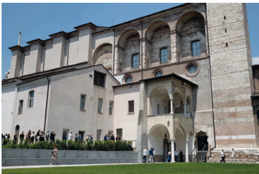
Chiostro di San Salvatore - Corridoio UNESCO