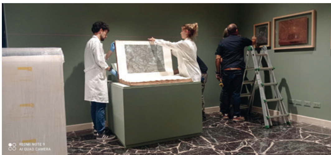
Fasi dell'allestimento della mostra Regina Viarum.