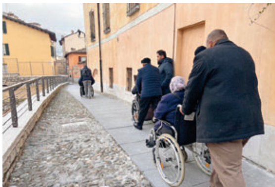
Accessibilità Teatro romano - Corridoio UNESCO