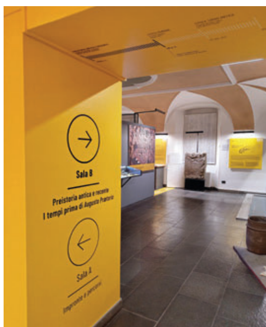
Personalizzazione imbotte sale.

Tutto ha avuto inizio con una domanda: come possiamo coinvolgere attivamente la comunità nella trasformazione di un museo? La risposta è stata il META/MAR, un progetto che trasforma il processo di ammodernamento del Museo Archeologico Regionale in un'esperienza interattiva e coinvolgente per tutti.