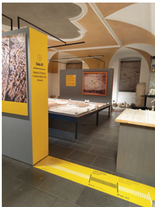
Personalizzazione divisione epoca/sale.