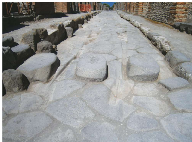
Figg. 8a-b Via di Nola da Ovest prima e dopo la rimozione di terra e dilavamenti.

Il progetto attuale continua a prevedere il supporto specialistico per le aree consolidate storicamente, per un totale di n. 32 postazioni di servizio giornaliera, grazie alle quali i professionisti di Ales collaborano ormai in maniera trasversale con tutte le aree funzionali dell'amministrazione, contribuendo al raggiungimento degli obiettivi strategici del Parco.