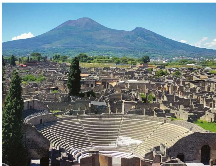
Fig. 1 Pompei vista dall'alto.

Nel giugno del 2014 il MiBACT ha stipulato con Ales un primo contratto per servizi di supporto finalizzati al miglioramento della fruizione negli scavi di