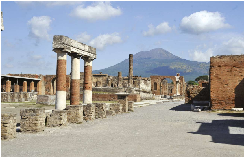
Fig. 2 Il Foro di Pompei da sud-est.

Pompei e al rafforzamento amministrativo specialistico per gli uffici della SAPES, afferenti a due Piani del GPP: Piano per la Fruizione e Piano per la Capacity Building.