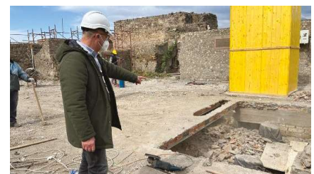
Fig. 7 Servizio Capacity Building: sopralluogo nel cantiere di Casa Bacco.

Anche in questo caso, dopo la prima fase di consolidamento del progetto, il rapporto di fiducia e di collaborazione instaurato con la committenza ha consentito di individuare per il prosieguo le soluzioni più idonee per una riprogettazione dei servizi coerente con il mutare delle esigenze della committenza.