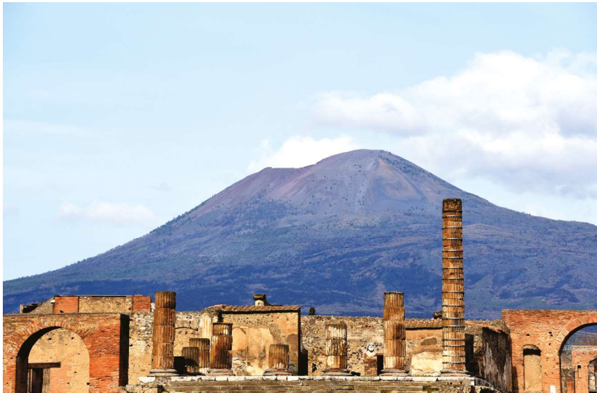
Fig. 13 Pompei, Tempio di Giove.

zazione di una nuova visione processuale ed integrata dei servizi , finalizzata a conferire maggior valore al prodotto finale. I servizi sono stati ricondotti all'obiettivo unitario di fornire al Parco un supporto affidabile ed efficiente per la gestione delle specifiche problematiche di fruizione e conservazione del sito. Uno degli elementi sui quali si è intervenuti è il potenziamento della comunicazione interna fra i responsabili dei diversi gruppi di lavoro per la condivisione e l'analisi delle informazioni risultanti dall'operatività quotidiana. Grazie alla proceduralizzazione di queste fasi è oggi possibile consegnare al Parco, nel corso di incontri periodici, una visione complessiva delle criticità e delle possibili soluzioni da condividere.