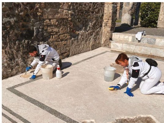
Figg. 11-12 Schola Armaturarum: interventi di messa in sicurezza degli apparati decorativi; Casa di Pansa: esecuzione di integrazioni e pulitura mosaico.

edilizi fra i quali la Schola Armaturarum , le Terme Suburbane, la Casa dei Vettii e il Larario di Achille, attraverso significativi interventi di manutenzione straordinaria eseguiti secondo una serrata tempistica.