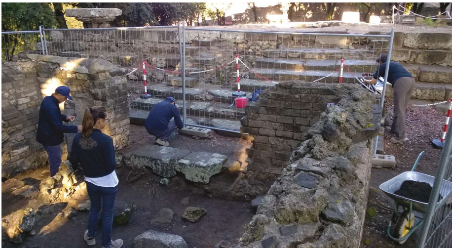
Figg. 9-10 Heron: fase di rilievo preliminare ad interventi su strutture murarie; Macellum: interventi di manutenzione della copertura.