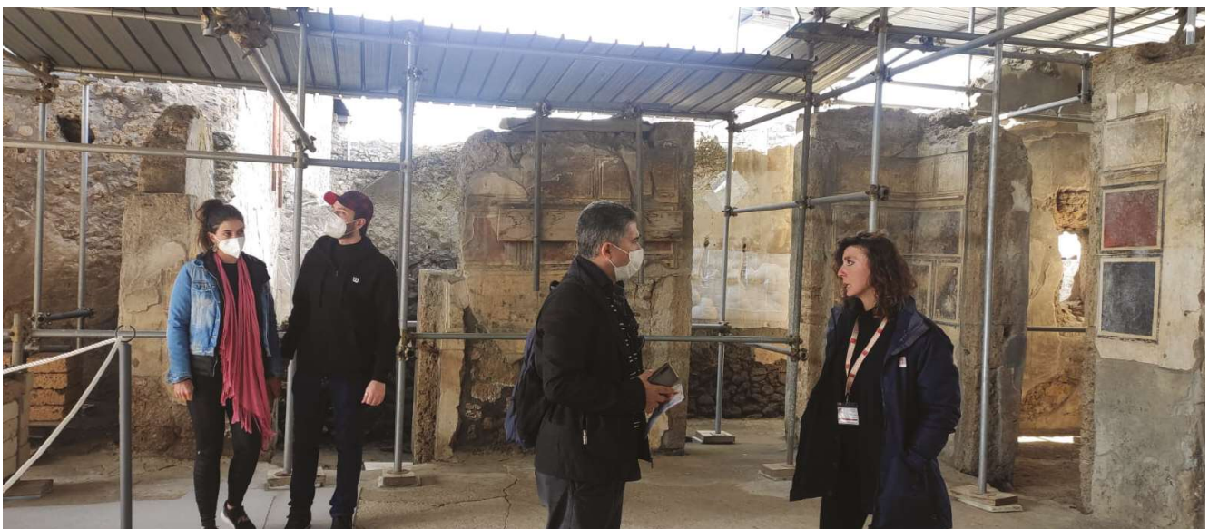
Fig. 5 Servizio di Sorveglianza nella Domus di Orione.

Con l'individuazione di questo nuovo ruolo, l'iniziale presidio statico richiesto per il GPP è stato progressivamente trasformato in un servizio dinamico e flessibile, capace di supportare la committenza, sia per le esigenze collegate alla fruizione (andamento stagionale delle aperture del sito, apertura di nuove domus, mostre, eventi etc.), sia, in maniera residuale, ma diffusa sul territorio, per quelle collegate alla conservazione. Il progetto prevede oggi la stessa tipologia di servizi finora citati, ma caratterizzati da maggiore flessibilità e qualità delle prestazioni, in funzione dell'approfondita conoscenza del contesto e delle dinamiche operative.