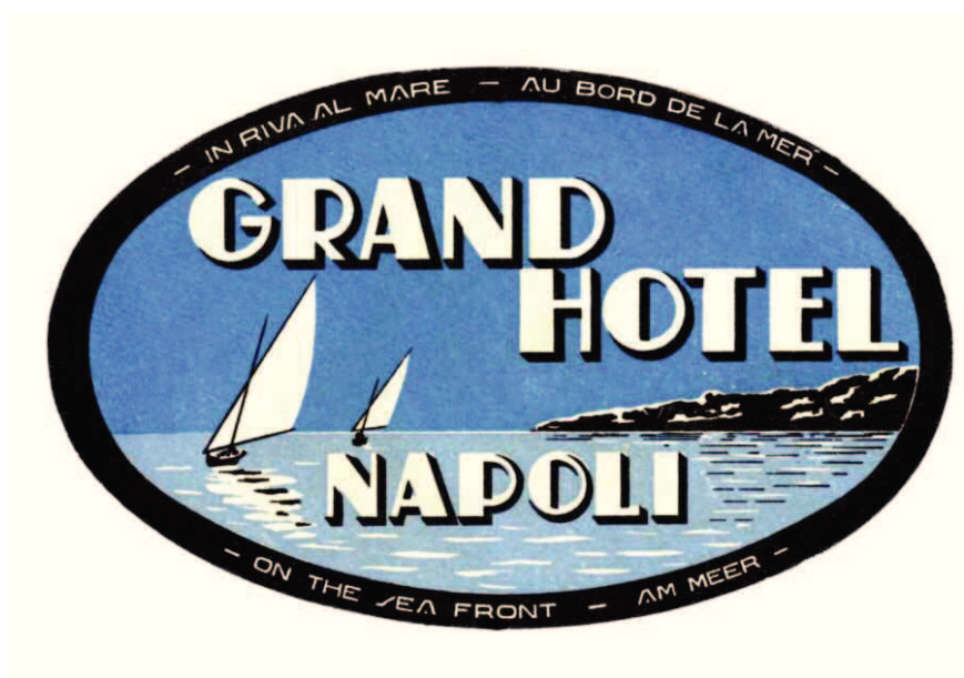
72 Pubblicità alberghiera per la valigia, Napoli, 1920 ca.

L'albergo, infatti, non è solo una struttura ricettiva. Sotto l'aspetto storico-antropologico è la porta d'ingresso di una cultura straniera nella relativa cultura locale. Sin dai tempi dei pellegrinaggi le foresterie (luoghi d'accoglienza per le persone provenienti da foris , da "fuori") erano luoghi d'incontro - più o meno accoglienti, non raramente anche ostili - tra culture diverse, che causarono spesso malumori sia negli ospiti che negli osti. Sulla scia degli ospizi di pellegrinaggio in seguito si svilupparono gli alberghi (un forestierismo anche questa parola, proveniente dal germanico hariberga ). Fin dai primi tempi moderni, si trattava di fondazioni di stranieri che vivevano nella relativa città e che si rivolgevano già a partire dal nome ( Hôtel du Russe , Hôtel Londra ) a una certa clientela nazionale offrendo anche cibi e piatti "nazionali". Il periodo d'oro dell'albergo in seguito fu l'epoca del Grand Tour. L'albergo diventa poi Hôtel , in francese, la prima lingua franca del turismo internazionale.