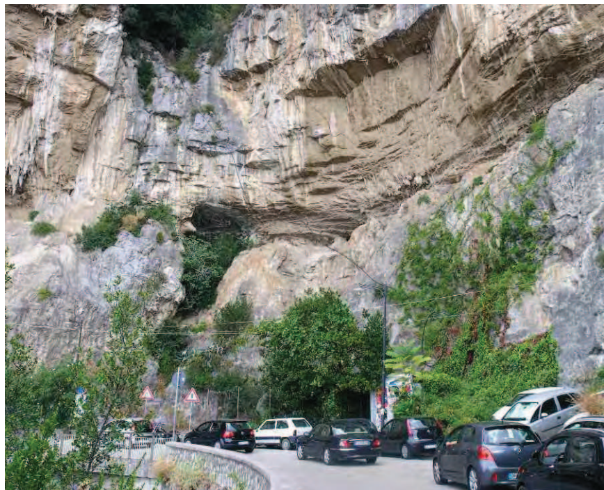
Fig. 1 - Il sito di Grotta La Porta di Positano.

L'attuale conformazione del sito di Grotta La Porta (Fig. 1) non ricorda certamente quello di una cavità ipogea, presentandosi piuttosto come un riparo sotto roccia poco profondo e sviluppato in lunghezza. Questo si apre all'interno della parete rocciosa della piccola conca costiera denominata, appunto, La Porta, poco prima del centro di Positano provenendo da Amalfi. Le stalattiti e le velature calcaree presenti all'interno e al di sopra di questo "riparo", che seguono tutto il perimetro della conca, denunciano la loro formazione in ambiente chiuso, rendendo del tutto probabile l'ipotesi avanzata da Radmilli e Tongiorgi, che il sito rappresenti, in effetti, il residuo di un'antica caverna un tempo più ampia. Sulla sua forma originaria, o almeno quella relativa al momento di frequentazione preistorica, non si può dire molto, se non osservare che sulla destra del riparo (guardandolo di fronte), una potente concrezione, che parte dal livello stradale fino a raggiungere l'altezza del sito, sezionata in continuità con la parete calcarea, potrebbe rappresentare parte del talus d'ingresso dell'antica grotta, suggerendo la probabile posizione dell'entrata e del suo orientamento.