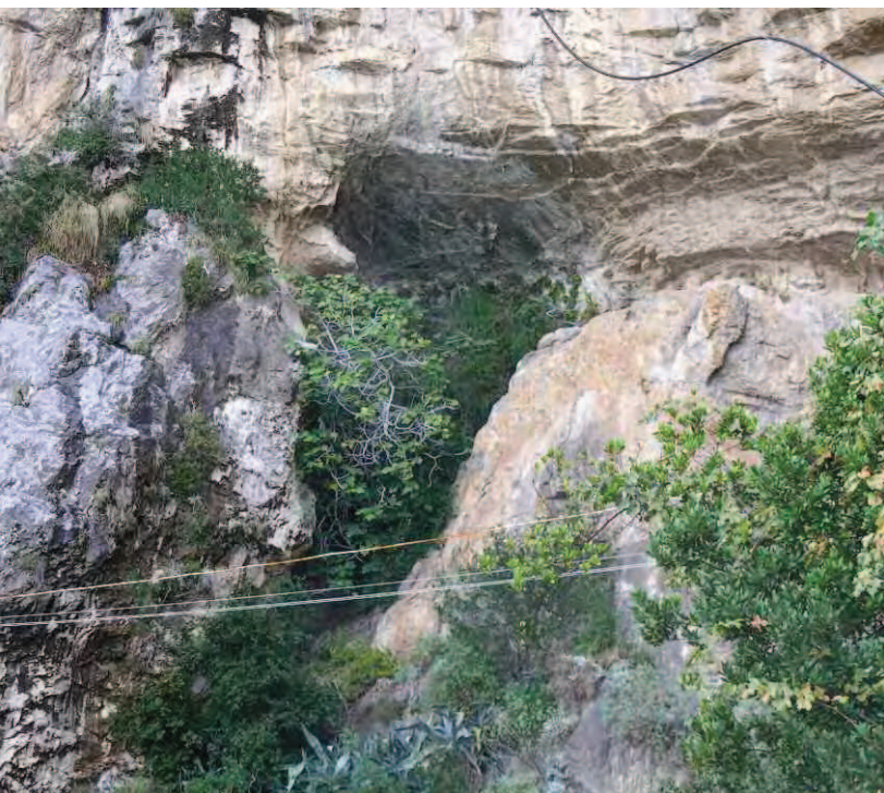
Fig. 2 - La nicchia contenente il riempimento archeologico asportato nello scavo del 1956.

Il deposito archeologico, quasi interamente asportato dallo scavo del 1956, si conservava solo in alcune nicchie di diversa profondità ed ampiezza che dipartono dal piano del riparo attuale, rappresentando, quindi, solo un residuo dell'originario riempimento: una di queste, seppur di estensione molto limitata (Fig. 2), restitui un deposito di oltre 5 metri di spessore e la stratigrafia di riferimento del sito.