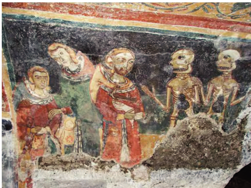
Fig. 5: Melfi (PZ). Chiesa di Santa Margherita. Il cosiddetto "Contrasto dei vivi e dei morti".

In quest'opera compare un ritratto di Federico II che si può confrontare con l'affresco di Melfi, le due immagini hanno molti elementi in comune: sopracciglia marcate, naso dritto, baffi divisi in due parti, labbro superiore avvallato al centro, barba corta, volto ovale e quando due artisti, sicuramente appartenenti a mondi tra loro lontani e diversi, convergono a tal punto nel ritrarre un comune soggetto. Basterebbe questa considerazione e un attento esame delle iconografie per affermare che si tratta della raffigurazione dell'imperatore Federico II 9 .