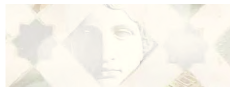
Fig. 2: Melfi (PZ). Chiesa di S. Margherita. San Pietro, Santa Margherita e le otto storie e San Pietro (da sinistra a destra).

nità umane dinnanzi al trapasso verso la vita ultraterrena. La denominazione di Trionfo della Morte , usata da alcuni critici, è più esatta se riferita alle versioni tarde di questo tema che compare anche in area abruzzese, come nel Duomo di Atri (1240-1250) e in area laziale (Poggio Mirteto e Montefiascone, inizi del XIV secolo), seppur con alcune varianti all'interno dello schema generale.