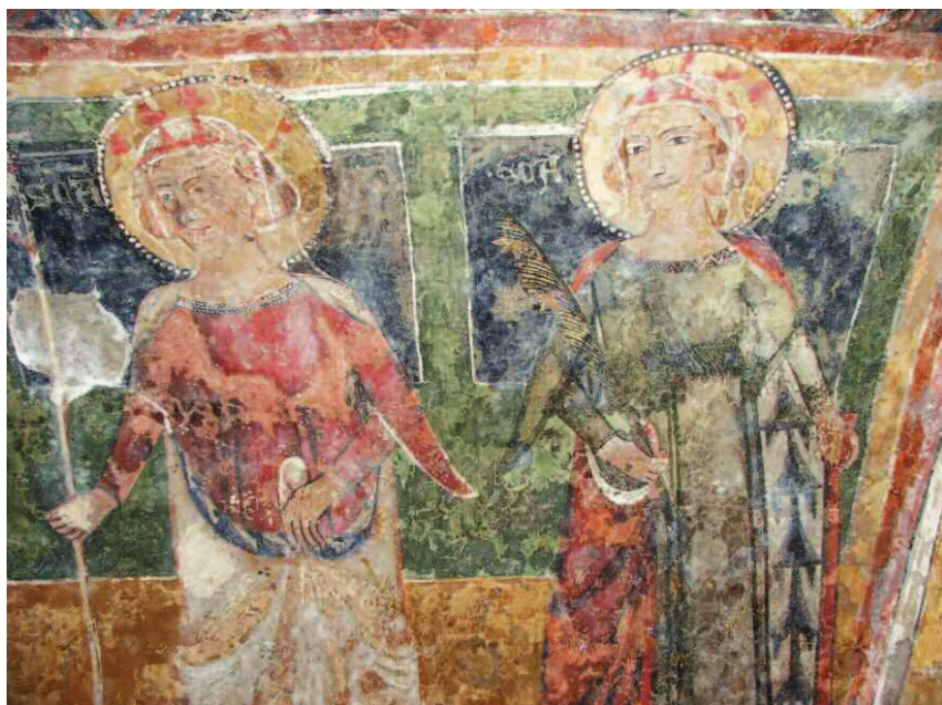
Fig. 4: Melfi (PZ). Chiesa di Santa Margherita. Sant'Orsola e una Santa anonima, probabilmente Santa Cordula.