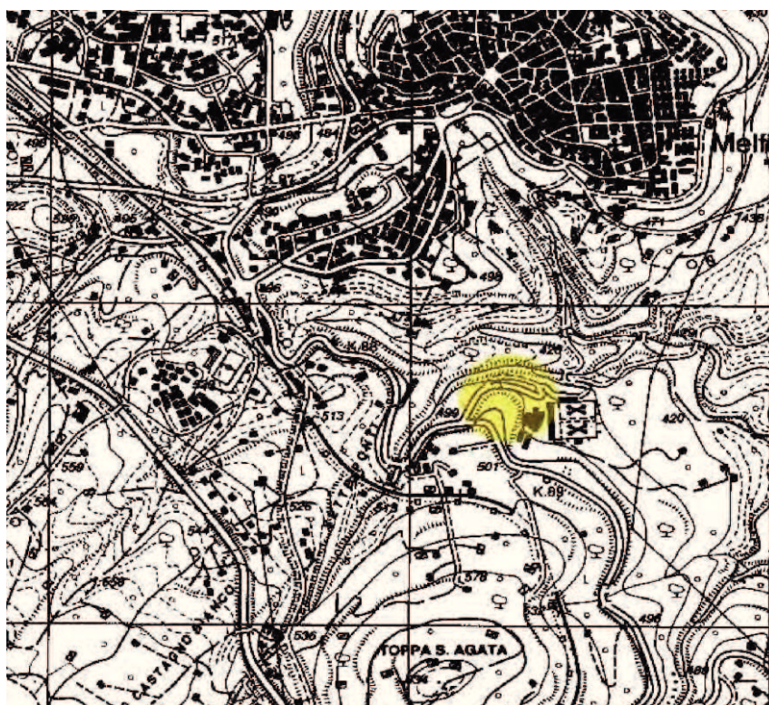
Fig. 1: Melfi (Pz). Localizzazione della chiesa di S. Margherita.

La chiesa-cripta di S. Margherita, situata lungo la strada che collega la città di Melfi con Rapolla (Fig. 1) fu scoperta e illustrata dal Guarini 1 nel 1899. Il santuario, che oggi si presenta in tutta la sua forma rupestre, è ad unica navata, interamente scavato nel tufo vulcanico, ed è fiancheggiato da quattro cappelle voltate a botte di diversa profondità.