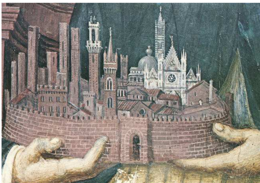
Anonimo, Beato Ambrogio Sansedoni, particolare, Siena, Palazzo Pubblico.

Il D.M. 23 dicembre 2014 ha puntato l'attenzione sulla necessità di mettere in rete i musei italiani integrandone i servizi e le attività. Così pensato, l'istituendo Sistema museale nazionale include i musei statali e, tramite convenzioni, ogni altro museo di appartenenza pubblica o privata che risponda agli standard decretati nel 2001, dall'«Atto di indirizzo sui criteri tecnico-scientifici e sugli standard di funzionamento e sviluppo dei musei». Alla Direzione generale Musei è demandato il compito