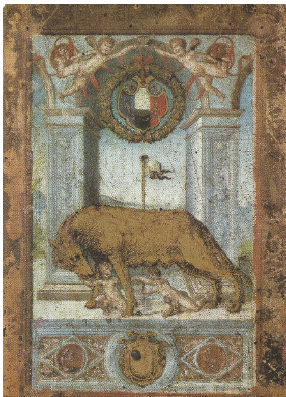
Camera del Comune, Archivio di Stato di Siena, n. 94.

posito. Il nuovo progetto prevede l'esposizione di tutte le opere Spannocchi Piccolomini al Santa Maria della Scala per una loro più organica fruizione e adeguata valorizzazione. L'accordo, della durata di dieci anni, prevede la stipula di successivi patti per l'elaborazione di piani strategici di sviluppo culturale, come indicati dall'art. 112 del Codice dei beni culturali. L'idea alla base dell'accordo è quella di creare nel tessuto cittadino senese un vero e proprio "museo diffuso" che inglobi non solo l'"acropoli" ma si espanda consapevolmente ad altri settori della città, compreso il territorio esterno al centro storico. Si sta lavorando per coinvolgere nuovi attori favorendo forme di partenariato e sostenendo la progettazione di buone pratiche indirizzate alla valorizzazione condivisa di tutte le risorse che rappresentano l'identità del territorio (MuSST). Con l'ampliamento della partecipazione delle comunità al Sistema Museale Cittadino di Siena prenderà maggior corpo quella eredità culturale che è parte integrante del "solo animale completo, con testa, cuore, arterie, zampe, di cui rimane lo scheletro quasi intatto, depositato su tre colli" (B. Berenson).