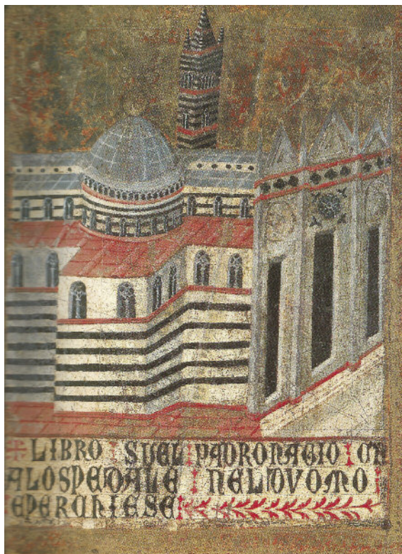
Biccherna, Ospedale di Santa Maria della Scala, Archivio di Stato di Siena, n. 95.

di sostenere la nascita di reti territoriali che coinvolgano diversi attori al fine di valorizzare il “museo diffuso” che caratterizza il paesaggio culturale italiano attraverso la promozione di sistemi innovativi di gestione dei musei e dei luoghi della cultura. All’interno di questa grande articolazione nazionale, i sistemi museali cittadini sono il nucleo dell’intero organismo, veri e propri centri propulsori per un’attenzione al patrimonio partecipata e fortemente intrecciata al vissuto delle comunità. Fondamentale diventa allora la cooperazione tra i soggetti pubblici competenti e gli attori presenti sul territorio.