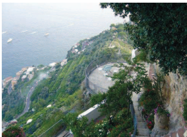
Fig. 5 Panorama della Villa Rondinaia a Ravello. Il terrazzamento del territorio impronta finora la struttura del paesaggio. Le terrazze sono anche un elemento fondamentale della architettura delle case. (Foto D. Richter).

Ceux qui arrivent à Amalfi aujourd'hui, y trouvent encore de nombreuses traces du passé euro-méditerranéen glorieux de la région; du paysage à l'architecture, au folklore et jusqu'aux mythes populaires dans lesquels se réfléchit le sentiment d'orgueil de la population locale, si fière d'appartenir aux descendants directs des marins et commerçants de l'ancienne Repubblica marinara di Amalfi .