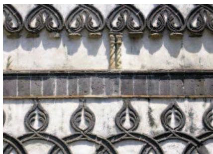
Fig. 6 Elemento architettonico nello stile "arabo-siculo" al cortile della Villa Rufolo di Ravello (XIII sec.).

À environ cinq kilomètres d'Amalfi, se trouve Ravello, un village perché dans la montagne avec vue sublime sur la Côte. S'inspirant du style mauresque, ce lieu avait déjà attiré l'attention des visiteurs au 19 ème siècle, comme Ferdinand Gregorovius qui rapporta, lors d'une visite en été 1853, ce qui suit dans son " Wanderjahren in Italien " (Pérégrinations en Italie): "J'ai découvert, dans le petit village de Ravello, presque autant d'architecture mauresque qu'à Palerme", et en effet, il n'existe point d'autre endroit en Méditerranée occidentale, en dehors de Palerme et de Grenade, où le style arabe (style que les historiens de l'art italiens nomment arabo-siculo ) est aussi présent. La Villa Rufolo datant du 13 ème siècle en est le meilleur exemple avec son cortile aux éléments architecturaux entrelacés en