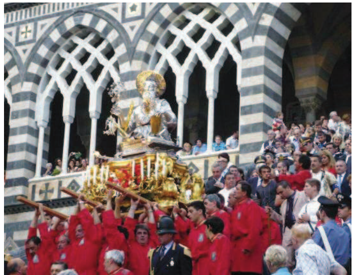
Fig. 4 La processione di Sant'Andrea nel 2007 ad Amalfi. La statua del Santo esce dal Duomo. In fondo gli archi intrecciati della facciata moderna che ricordano i modelli medievali.

Dans le cadre des relations euro-méditerranéennes qu'entretenait la ville d'Amalfi dans un champ de tensions entre l'Occident et l'Orient, la vénération des saints occupait une place importante, ces derniers renforçant l'identité locale comme partout ailleurs dans le Sud catholique. Il est frappant de constater que bon nombre de saints des différentes localités de la Côte amalfitaine étaient originaires du Levant c'est-à-dire de la région gréco-byzantine et, selon les récits culturels locaux, auraient été introduits dans la région par voie de mer. San Pantaleone, le Saint-patron de Ravello, est vénéré dans l'église locale mais également dans le quartier de Saint-Marc, à Venise: il représente l'un des plus importants saints protecteurs de la Côte amalfitaine. Les reliques des saints de Minori, de Santa Trofimena (cette sainte reste encore largement méconnue dans toute l'Europe latine) se sont échouées sur la rive après une étrange traversée. Il en va de même pour la Madonne de Positano, une icône byzantine qui, selon la légende locale, aurait été embarquée par des marins venant du Levant orientale puis se serait échouée à Positano lors d'une accalmie. Le culte, diversement répandu sur la