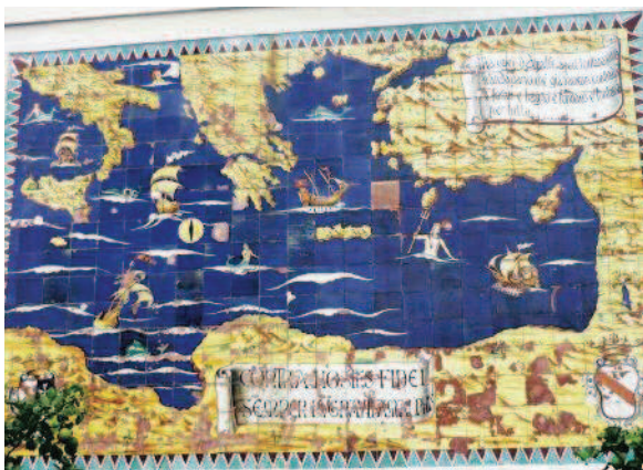
Fig. 2 La Mappa del Mediterraneo alla Porta Marina di Amalfi (1950) evoca la memoria della grande storia euromediterranea della città e delle sue attività nel Mediterraneo orientale. In alto a destra i versi di Gabriele d'Annunzio: "Ma quei d'Amalfi a più lontana patria n'andavano/ ché già avean contrada e forno e bagno e fondaco e fontana per tutto...". Una interpretazione cristiana ben diversa della storia amalfitana suggerisce invece il detto al centro: "Contra hostes fidei semper pugnavit Amalphis". (Foto D. Richter).

et l'Orient. Parmi les produits importés que les navires amalfitains convoyaient vers l'Europe latine se trouvaient, en particulier, des articles de luxe comme le poivre, la cannelle, la muscade et autres épices, le sucre (en arabe " sukkar "), l'or, l'ivoire et les perles. Le bois d'œuvre, la soie calabraise et le lin repartaient dans l'autre sens, pour être exportés en Orient et en Afrique du Nord. Amalfi participait également au transport des passagers européens qui partaient en pèlerinage vers les lieux saints de Palestine, une activité florissante. Un conflit survenu en 879 montre bien à quel point les réseaux de politique économique étaient parfois bien plus importants