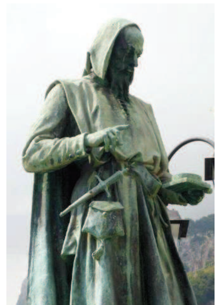
Fig. 3 La statua di Flavio Gioia al porto di Amalfi.

La boussole est également une invention chinoise introduite en Méditerranée par les Arabes. Toutefois, des ouvrages scientifiques attribuent depuis le 16 ème siècle son "invention" aux Amalfitains, et en particulier à un certain Flavio Gioia. "Les Amalfitains furent les premiers à pratiquer la navigation à l'aide de l'aiguille de la boussole ( calamita )", lit-on dans la Descrizione di tutta Italia (1550) de Leandro Alberti. Il semblerait, d'après de récentes recherches, que cette technique ait grandement été améliorée par les marins amalfitains qui combinèrent cette aiguille aimantée avec la rose des vents.