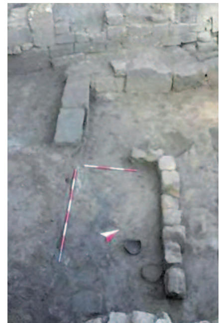
Fig. 9 Foro di Cuma. Trasformazioni del complesso abitativo arcaico, nel corso del VII secolo a.C.

Nel rapporto dunque tra l'insediamento euboico sull'isola – Pithecusa – e quello sulla terraferma – Cuma – queste recenti scoperte archeologiche suggeriscono di considerare le due realtà parte integranti di un'unica strategia di occupazione di spazi, sia marittimi che territoriali, da parte dei Greci provenienti dall'Eubea; è una strategia di espansione e consolidamento che ha avuto tempi e modi differenti e che ricorda, molto da vicino, quanto racconta Erodoto per Cirene, con la scansione di tempi successivi di occupazione e di organizzazione, prima sull'isola di Platea e poi sulla terraferma, dove i Terei fondano la colonia di Cirene.