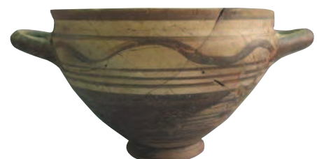
Fig. 10 Foro di Cuma. Coppa italo-geometrica dal complesso abitativo di VII secolo a.C.