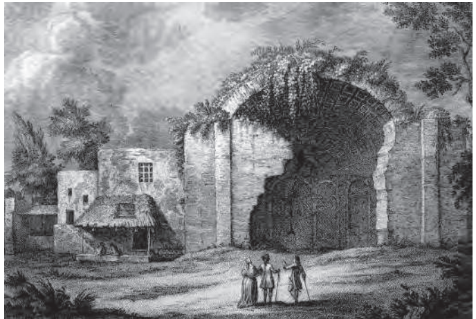
Fig. 3 Foro di Cuma. La Masseria del Gigante in una tavola del Morghen.

L'attenzione rivolta alla conoscenza dell'ambiente e del paesaggio è affidata alla ricerca dell'équipe del Centre Jean Bérard ; è stata così ricostruita l'evoluzione geomorfologica del li-