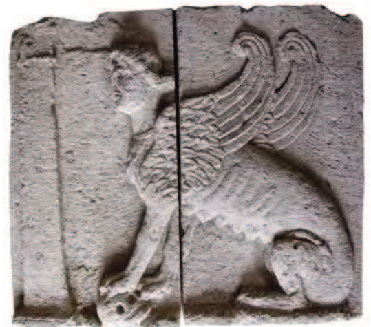
Fig. 24 Monumento funerario: blocchi del recinto con sfinge.

Alla ricchezza ed alla varietà dei monumenti e delle aree esplorate si accompagnano le migliaia e migliaia di oggetti che raccontano della vita quotidiana, dei costumi alimentari, dei commerci e degli scambi, di un artigianato raffinato e vivace; raccontano la cultura materiale della città nelle sue diverse fasi di vita e dunque nei suoi profondi cambiamenti.