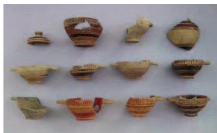
Figg. 13a, b Foro di Cuma. Materiali votivi tardo-arcaici dalle aree santuariali.