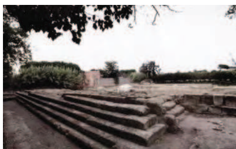
Fig. 23 Lo stadio.