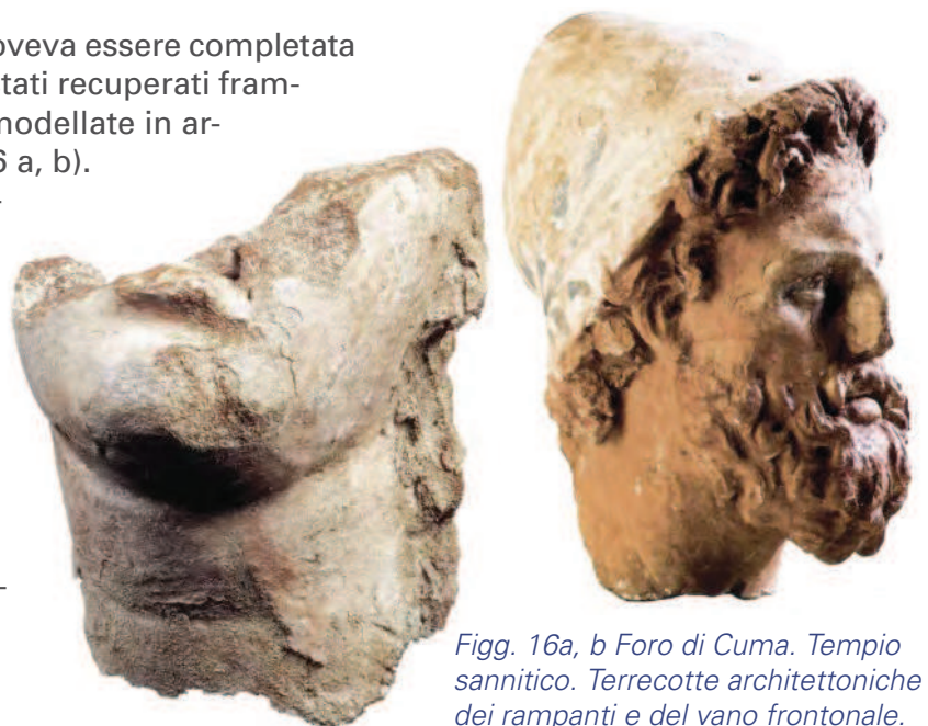
Figg. 16a, b Foro di Cuma. Tempio sannitico. Terrecotte architettoniche dei rampanti e del vano frontonale.

La decorazione del tempio sannitico doveva essere completata da frontoni con altorilievi di cui sono stati recuperati frammenti di figure femminili e maschili, modellate in argilla e dipinte con vivaci colori (Fig. 16 a, b). In una rilettura complessiva dell'artigianato cumano dove la pittura parietale dunque riveste un ruolo di notevole importanza, suscita un interesse notevole una tomba dipinta rinvenuta immediatamente fuori le mura nel 2004. È una tomba a camera a doppio spiovente che conserva sulle pareti una zoccolatura a fascia in rosso con onda corrente; sulla parete est, di fronte al-