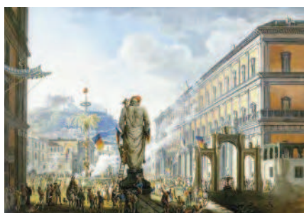
Fig. 2 Il "Gigante di Palazzo" durante la rivoluzione del 1799. Dipinto. Museo di San Martino, Napoli.