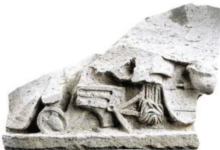
Fig. 18 Foro di Cuma. Portico in tufo grigio decorato con fregio d'armi di età protoaugustea.

Lo spiazzo che delimitava il Foro sannitico verrà ristrutturato tra l'età sillana e l'età augustea e al di sopra delle fondazioni del portico in tufo giallo verrà ricostruito un nuovo portico in tufo grigio a doppio ordine di cui quello inferiore decorato da un fregio d'armi (Fig. 18), già noto dagli scavi del Maiuri, ma del quale sono stati recuperati numerosi altri elementi che ne consentiranno la ricomposizione ed una migliore lettura sia cronologica che interpretativa.