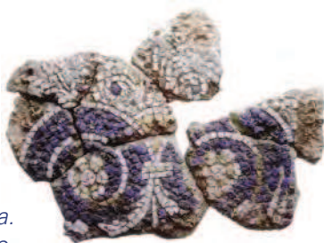
Fig. 21 Foro di Cuma. Mosaico policromo dal ninfeo.

Tra i tanti monumenti che hanno arricchito la realtà strutturale del Foro cumano, va segnalato un piccolo ninfeo a camera con