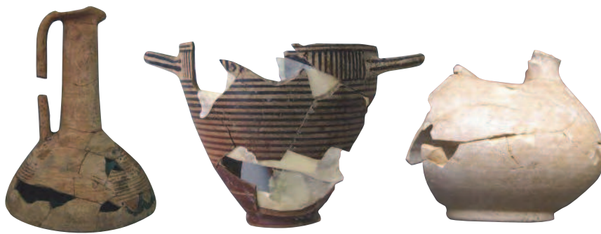
Figg. 8a, b, c Foro di Cuma. Ceramica corinzia di importazione e di produzione locale.

alimentari che definiscono un'organizzazione insediativa articolata tra spazi coperti e spazi scoperti, piuttosto estesa e compatta.