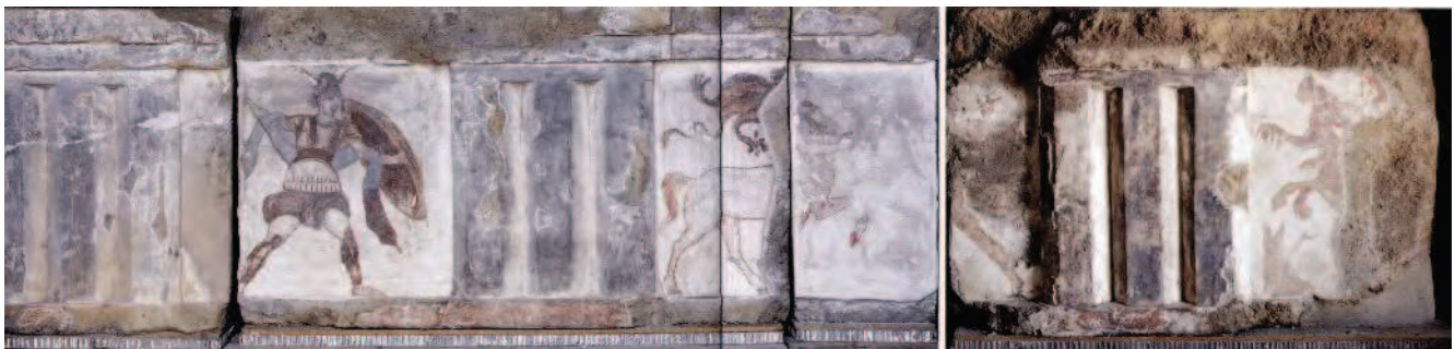
Fig. 15 Foro di Cuma. Tempio sannitico. Metopa dipinta con rappresentazione di una centauromachia.

La decorazione del tempio sannitico doveva essere completata da frontoni con altorilievi di cui sono stati recuperati frammenti di figure femminili e maschili, modellate in argilla e dipinte con vivaci colori (Fig. 16 a, b). In una rilettura complessiva dell'artigianato cumano dove la pittura parietale dunque riveste un ruolo di notevole importanza, suscita un interesse notevole una tomba dipinta rinvenuta immediatamente fuori le mura nel 2004. È una tomba a camera a doppio spiovente che conserva sulle pareti una zoccolatura a fascia in rosso con onda corrente; sulla parete est, di fronte al-