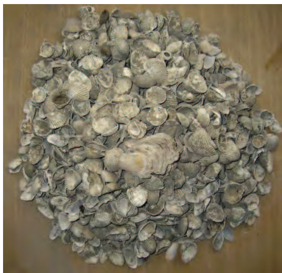
Fig. 5 Foro di Cuma. Reperti malacologici.

I nuovi dati documentano piuttosto come l'abitato indigeno sia molto più esteso ed articolato ed occupi anche