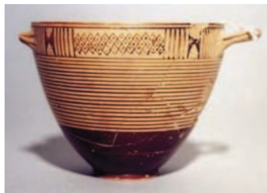
Figg. 11a, b Foro di Cuma. Ceramica di produzione pitecusano-cumana.