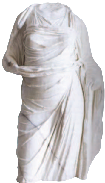
Fig. 20 Foro di Cuma. Statua femminile in marmo dal Tempio della Masseria.

tito una ricostruzione grafica convincente. Il complesso è stato innalzato in età flavia ed è stato identificato, con buone ragioni, con un tempio dedicato al Divo Vespasiano che viene ricordato in un'epigrafe rinvenuta nel 1785 a Baia.