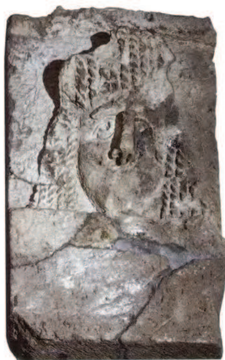
Fig. 19 Foro di Cuma. Portico in tufo grigio decorato con maschere teatrali di età sillana

Il tempio con abside semicircolare al centro del lato meridionale e pronao esastilo era collocato al fondo di un grande piazzale scoperto, lastricato in marmo bianco e circondato da un portico su tre lati di cui sono stati recuperati numerosi elementi della decorazione architettonica che ne hanno consen-