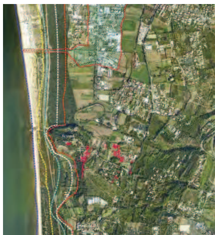
Fig. 4 Foro di Cuma. Modificazione della linea di costa nel corso del III secolo a.C.

torale ed è stato ben documentato come non vi sia alcun porto chiuso, così come si credeva, in una depressione a sud-ovest dell'acropoli, ma piuttosto il litorale sia caratterizzato dalla presenza di una spiaggia stretta e fortemente allungata dove poter tirare a secco le navi; l'antica laguna di Licola , a nord dell'acropoli, in comunicazione con il mare, offriva le migliori condizioni ambientali per un riparo costiero.