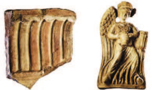
Fig. 14 Foro di Cuma. Tempio sannitico. Antefissa con figura femminile alata.

Il recupero di migliaia di frammenti ha consentito una ricostruzione plausibile della decorazione architettonica che comprendeva un fregio fittile decorato da motivi vegetali a protezione dell'architrave ligneo ed una serie di antefisse che raffigurano una figura alata che regge tra le mani uno stamnos o un'hydria; sono state interpretate come immagini delle ladi, le nuvole e, di recente, è stata proposta la lettura di un corteo di Pleiadi che trasportano ambrosia per gli dei (Fig. 14). E soprattutto era stato scaricato nel riempimento del podio anche una parte consistente del complesso di metope in tufo dipinte con triglifi scanalati. Le metope, in tufo, costituiscono un rarissimo esempio di decorazione dipinta architettonica, per altro ben conservata nella vivacità del colore; le figure dipinte offrono un livello pittorico piuttosto elevato e si inseriscono nel solco della tradizione della pittura ellenistica di pieno IV secolo a.C. Sulle metope sono raffigurate una centauromachia e, probabilmente, un'amazzonomachia (Fig. 15).