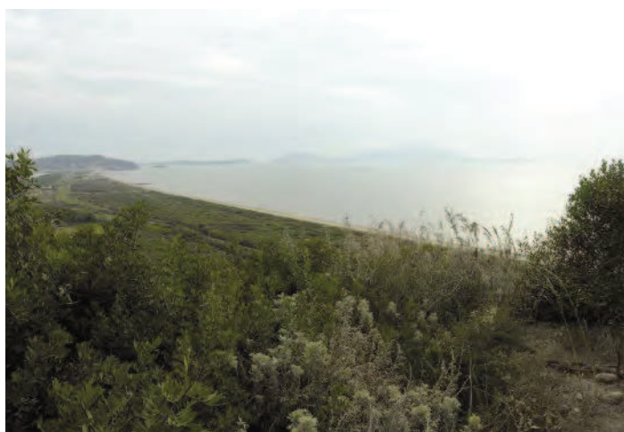
Fig. 1 L'isola di Ischia vista dall'acropoli di Cuma.

Alla fine dell'800, Emilio Stevens, figlio di un diplomatico inglese che si stabilisce a Napoli dove sposa l'erede di una ricca famiglia della borghesia napoletana, appassionato di antichità, avvia l'esplorazione in una delle necropoli cumane che porta avanti per oltre 10 anni, recuperando un patrimonio ingente e conducendo uno scavo, per quel tempo innovativo, con la minuziosa registrazione di tutte le fasi dello scavo. Sarà Ettore Gabrici a pubblicare, nel 1913, in una pregevole monografia, la maggior parte dei corredi recuperati dallo Stevens ricostruendo così lo sviluppo diacronico della necropoli greca ed il suo rapporto con quella preellenica e gettando le basi per la conoscenza delle prime testimonianze arcaiche greche in Occidente.