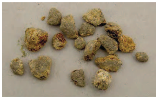
Fig. 7 Foro di Cuma. Frammenti di ambra grezza dalla casa ad ante.

La presenza di numerose scorie di ferro, ciottoli di lavorazione, un pane di bronzo e frammenti di ambra grezza suggeriscono anche una qualche attività funzionale (Fig. 7). Nell'area, inoltre, sono stati intercettati altri piani di calpestio con identiche caratteristiche strutturali e fosse per l'alloggiamento di contenitori per lo stoccaggio di derrate