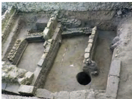
Fig. 6 Foro di Cuma. Casa ad ante nell'area Foro di Cuma (fine VIII - inizio VII secolo a.C.).

Una presenza stanziale sul litorale cumano si colloca, oggi ragionevolmente, già negli anni a cavallo della metà dell'VIII secolo, così come testimoniano i tanti materiali rinvenuti in tutta l'area della città bassa.