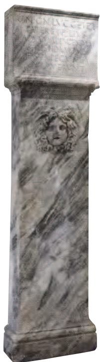
Fig. 22 Foro di Cuma. Fontana in marmo lunense dal ninfeo.

È lo stadio di Cuma (Fig. 23), caratterizzato da un'ampia gradinata per gli spettatori organizzata in settori differenti, da una tribuna per i giudici su un alto podio che sovra-