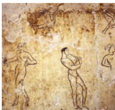
Fig. 17a, b Foro di Cuma. Tomba a camera dipinta di età sannitica.

sgabello; vestita del tradizionale costume osco, esibisce monili d'oro, in mano regge due melagrane ed indossa una corta mantellina ed anch'essa porta in capo una ricca corona identica a quella del marito; sulle lastre dello spiovente sono dipinte scene di danze che si svolgono