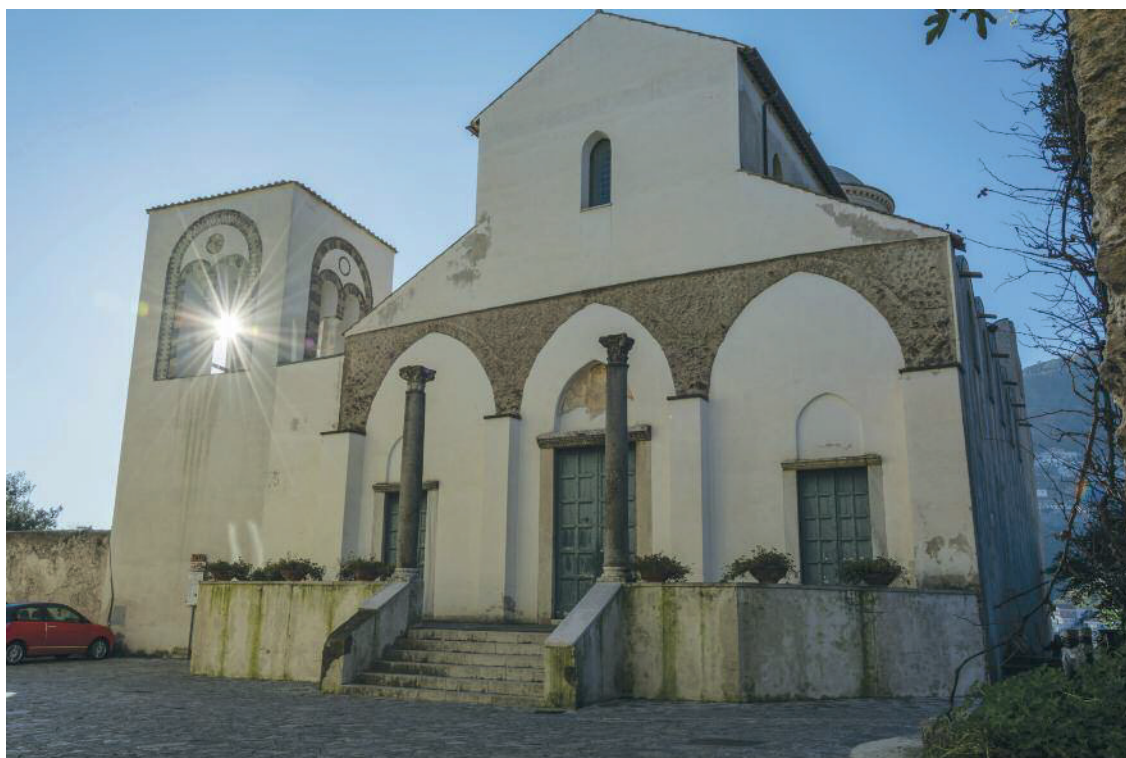
94 Chiesa di San Giovanni del Toro, Ravello.

Con l'incarnazione il Verbo irrompe nella storia per rendersi visibile e pertanto rappresentabile e ripresentabile attraverso i sacramenti. L'arte nel cristianesimo unitamente alla santità costituisce l'espressione massima dell'avvicinamento della creatura umana alla natura divina e dell'omaggio del credente a Dio per riconoscerlo Signore. «Per tali motivi la santa madre Chiesa è stata sempre amica delle arti liberali ed ha sempre ricercato il loro nobile servizio» ( Sacrosanctum Concilium 122). I fruitori delle manifestazioni popolari, in sintonia con i loro protagonisti, sono sospinti a raggiungere l'essenza ineffabile del reale aprendosi al desiderio del raccoglimento spirituale.