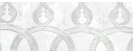
Abbazia di Santa Maria de' Olearia, Maiori.