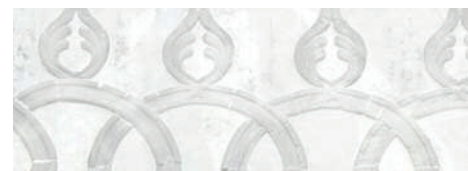
Luminaria di San Domenico, Praiano.

Si deve inoltre precisare che nel contesto cristiano una qualsivoglia tradizione non è sacra in quanto tale, bensì indirizzata al sacro. Il sacro nella connotazione ecclesiale non è nel senso della separazione dall'uomo, bensì della consacrazione dell'uomo. Pertanto ciò che è dedicato al sacro giova alla santificazione dei fedeli ed esprime l'incontro con Dio. Ne deriva che le tradizioni religiose e le sacre rappresentazioni devono essere congrue ai riti liturgici e alla spiritualità cristiana, tanto da favorire e significare l'edificazione dei fedeli. Pertanto in esse si compongono la connaturale apertura dell'uomo al «sacro» e l'incontro con il «santo» della liturgia.